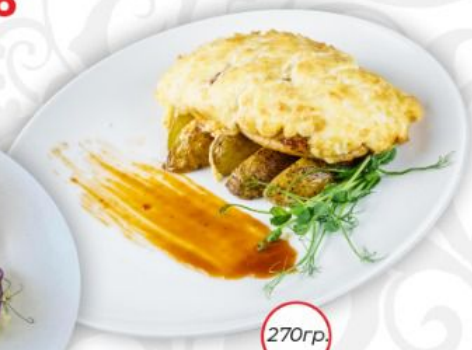
Филе цыпленка с томатами и сыром с картофельными дольками соусом барбекю