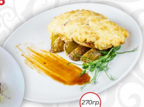
Филе цыпленка с томатами и сыром с картофельными дольками соусом барбекю