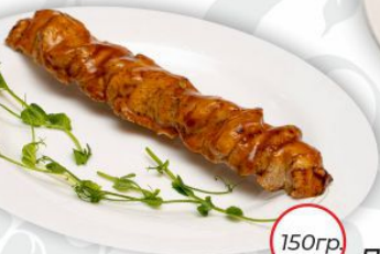
Шашлык куриный в соусе барбекю