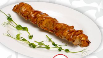
Шашлык куриный в соусе барбекю